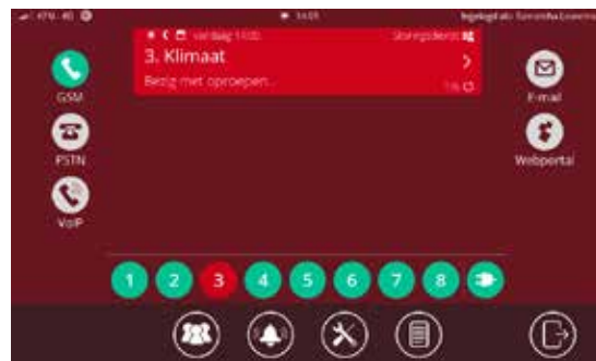
Weergave van uw alarmmelding

Adésys is met 4 decennia ervaring dé specialist in het vakgebied telefonische alarmering. Deze 5 e generatie Octalarm bevat de nieuwste technieken. Hierdoor wordt het mogelijk om veilig en betrouwbaar te alarmeren via de (sterk veranderende) hedendaagse digitale telefonienetwerken. Met de Octalarm-Touch bent u klaar voor de toekomst!