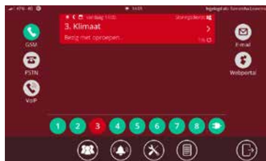
Weergave van uw alarmmelding

Adésys is met 4 decennia ervaring dé specialist in het vakgebied telefonische alarmering. Deze 5 e generatie Octalarm bevat de nieuwste technieken. Hierdoor wordt het mogelijk om veilig en betrouwbaar te alarmeren via de (sterk veranderende) hedendaagse digitale telefonienetwerken. Met de Octalarm-Touch bent u klaar voor de toekomst!