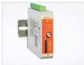
SVM 3G modem