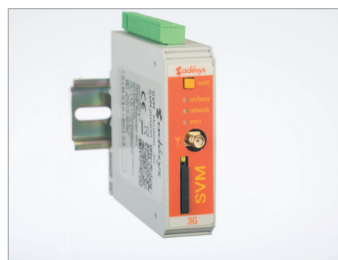
SVM 3G modem